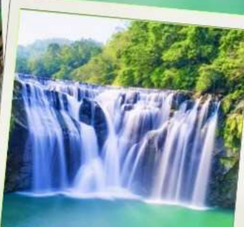
น้ำตกสี่เฟิ่น