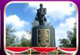
อนุสาวรีย์กรมหลวงชุมพรฯ