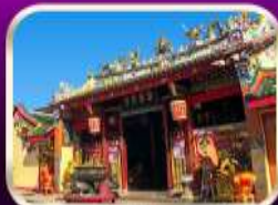
ศาลเจ้าแม่ลิ้มกอเหนี่ยว

ที่เที่ยวเพิ่มขึ้น และ ช่วยฟื้นฟูเศรษฐกิจขนาดใหญ่