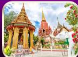
หอพระหลวงปู่ทวด วัดช้างให้