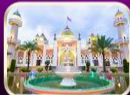
ชมบึงสีดินกลางปิตดาณี