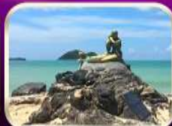
เที่ยวหาดสมิหลา สงขลา