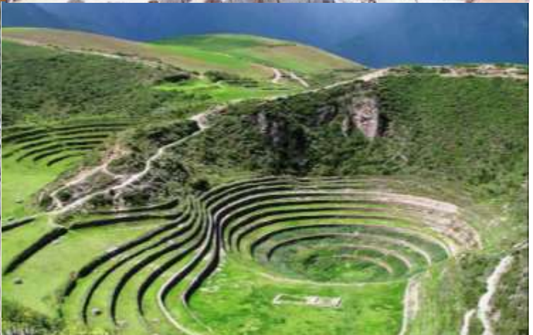
บ่าย นำท่านเดินทางสู่ มาราซ (Maras) แหล่งผลิตเกลือที่คุณภาพดีที่สุดในโลก ที่มีมาตั้งแต่สมัยอินคา แนวนาชั้นบันไดที่เรียงอยู่ตามลำดับความสูงของภูเขา จากนั้นเดินทางสู่ โมเรย์ (Moray) นาชั้นบนโดวงกลมขนาดใหญ่หลายวงรูปร่างแปลกตาที่ชาวอินคาทำไว้เพื่อทดลองปลูกพืชพันธุ์ต่างๆ จากจุดนี้สามารถมองเห็น หมู่บ้านอูรัมบัмба (Urubamba) ได้อีกด้วย ได้เวลาเดินทางกลับสู่เมือง เมืองคัสโก (Cusco) เมืองหลวงของอาณาจักรอินคา ที่แพร่ขยายอำนาจจนกินพื้นที่ 1 ใน 3 ของอเมริกาใต้ ตั้งอยู่เหนือระดับน้ำทะเลถึง 3,400 เมตร และเป็นแหล่งอารยธรรมยุคก่อนประวัติศาสตร์ที่ลึกลับน่าทึ่ง เป็นชุมชนเก่าแก่ของจักรวรรดิอินคาอันรุ่งเรือง ซึ่งยังคงทิ้งร่องรอยความเจริญไว้ให้เห็นเป็นซากปรักหักพังโบราณและโบราณวัตถุต่างๆ