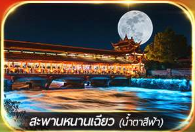
สะพานหนานเฉียว (น้ำตาสีฟ้า)