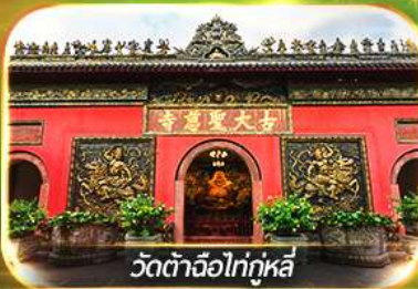
วัดต้าฉือไท่กุหลี่