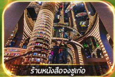
ร้านหนังสือจางชู่เกอ

เที่ยวชมทัศนียภาพ 2 อุทยาน บิ่เฟิงโกว & ชวงเฉียวโกว เช็คอินแพนด้าเซลฟ์ & แพนด้าปิ่นตึก ซุปปิ้งจุกี่ถนคนคนเดินชุนซีลู่