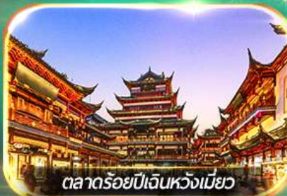
ตลาดร้อยปีเดินหวังเหมียว