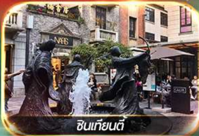
ซินเทียนตี้