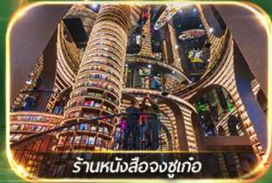
ร้านหนังสือจางซูเก้อ

เที่ยวชม 2 อุทยาน ปี้เฟิงโกว & จิวจ้ายโกว (รถเหมา)