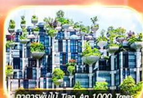
อาคารพันไม้ Tian An 1,000 Trees