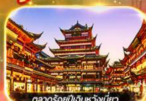
ตลาดร้อยปีเงินหวงเหมียว

เที่ยวดิสนีย์แลนด์เต็มวัน (รวมบัตร + รถรับส่ง) ช้อปปิ้งย่านดัง, นานกิง, เจินหวงเหมียว