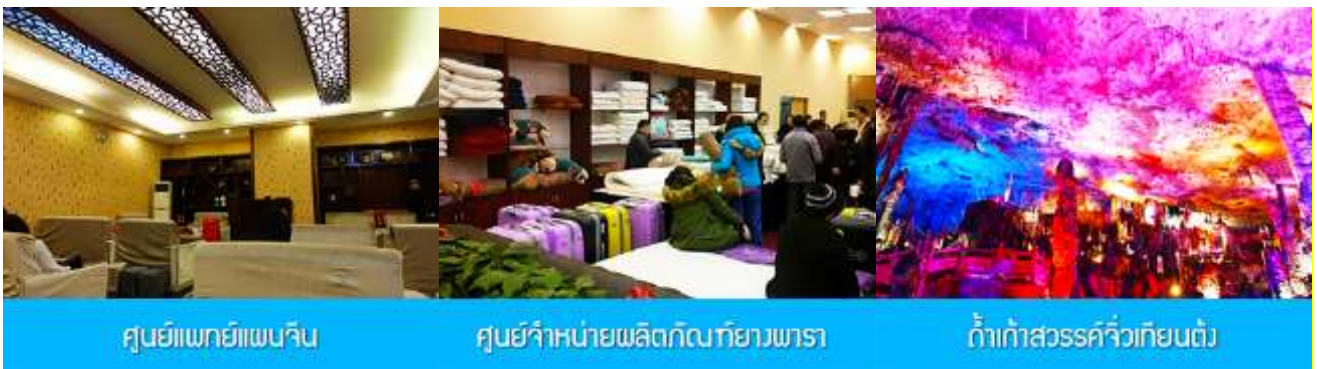
ศูนย์แพทยแผนจีน

อัตราค่าบริการสำหรับโปรแกรมเสริมการแสดงชุด The love Story of Wooden man and Fairy Fox ท่านละ 400 หยวน (หรือประมาณ 2000.-บาทขึ้นอยู่กับอัตราแลกเปลี่ยน) ระยะเวลาที่ใช้ในการเที่ยวชมการแสดง ประมาณ 3 ชั่วโมง รวมเวลา เดินทางไป กลับค่าบริการรวม ค่าบัตรเข้าชม ค่ารถรับ ส่ง และค่าน้ำดื่มของไกด์ท้องถิ่น