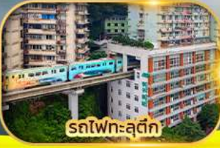
รถไฟฟ้า-สุดค