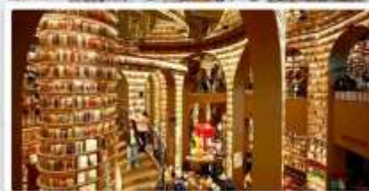
ร้านหนังสือจงซูเก๋

เดินทางโดย: สายการบินเจ็ดทูเออร์ไลน์ (EU)