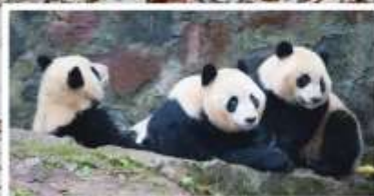
หุบเขาแพนด้า