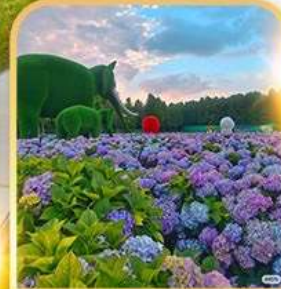
ดอกไม้ตามฤดูกาล