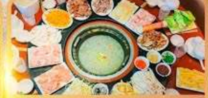
สุกี้เห็ด