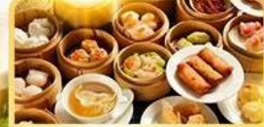
อาหารกวางตุ้ง