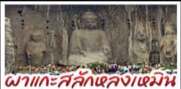
ผาแกะสลักหลงเหมิน

เที่ยวครบ 4 มรดกโลก ถ้ำหลงเหมิน - สุสานจิ๋มซีซ่งเต้ - วัดเส้าหลิน หมู่บ้านไต้ดินสามโจ้ว - หมู่บ้านทิวเสี่ยงซุบ