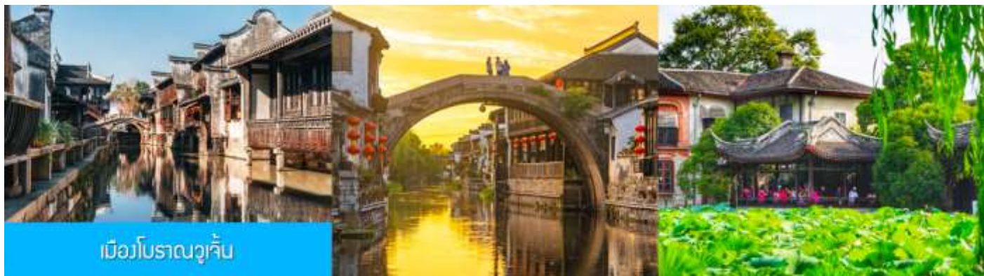
เมืองโบราณวูเจิ้น