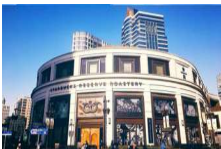
Starbuck Reserve Roastery