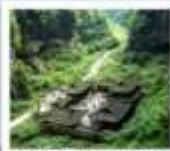
หุบเขาไฟสพานสวรรค์