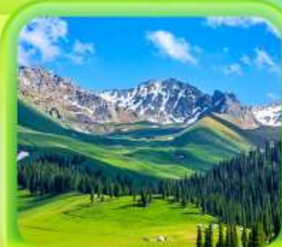
"กุ่มหญ้านาราตี"