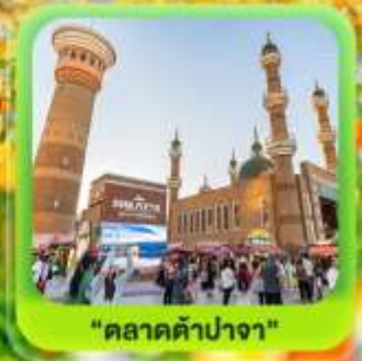
"ตลาดต้าปาจา"

ซินเจียงเหนือ ทะเลสาบโซลิมู๋ "น้ำตาหยดสุดท้ายของแอตแลนติก" • กุ่มหญ้านาราตี กุ่มดอกไม้เทียนซาน • ผ่านชมสะพานกั๋วโจ้วโกว • ถนนหลิวซิงเจียง • ตลาดต้าปาจา