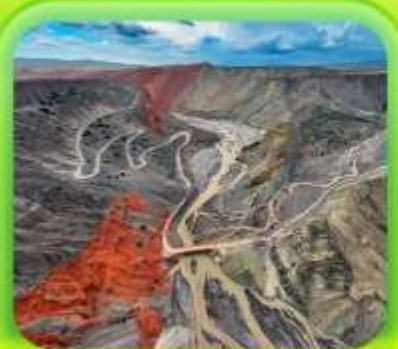
"แกรนด์แคนยอนคู่ชานโจ้ว"

ซินเจียงเหนือ ทะเลสาบโซลิมู๋ "น้ำตาหยดสุดท้ายของแอตแลนติก" • กุ่มหญ้านาราตี กุ่มดอกไม้เทียนซาน • ผ่านชมสะพานกั๋วโจ้วโกว • ถนนหลิวซิงเจียง • ตลาดต้าปาจา