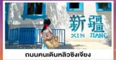
ถนนคนเดินหลิวซิงเจียง