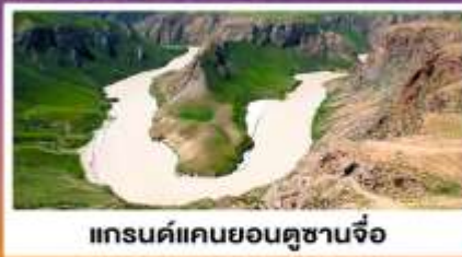
แกรนด์แคนยอนคูซานจื่อ