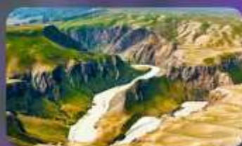
แกรนด์แคนยอนคูซานจื่อ