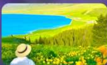
ทะเลสาบไซ่หลี่มู่