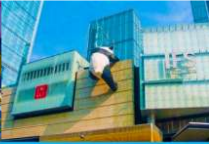
หมีแพนด้าปีนตึก ณ ตึก IFS