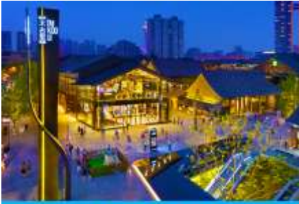
ถนนไคกุ่หลี่ และวัดต้าเจี๋ย