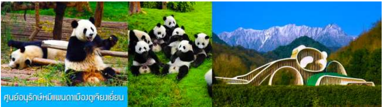
ศูนย์อนุรักษ์หมีแพนด้าเมืองตูเจียงเยียน

หลังอาหารท่านสามารถเลือกที่จะซื้อ โปรแกรมทัวร์เสริม หรืออิสระพักผ่อนตามอัธยาศัยใน โรงแรม