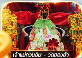
เจ้าแม่กวนอิม - วัดทองฮ่า