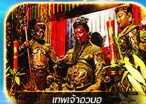
เทพเจ้าอวตาร