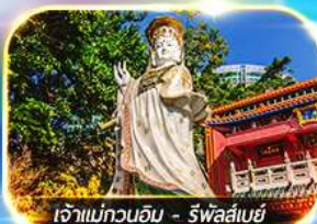
เจ้าแม่กวนอิม - รัฟัสเบย์