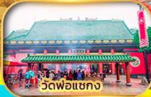
วัดพ่อแชกง