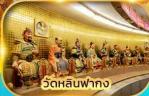
วัดหลินฟากง