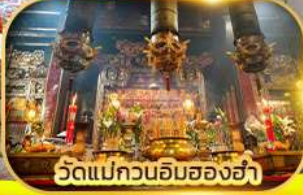
วัดแม่กวนอิมฮ่องอ่า