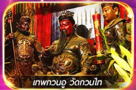
เทพกวนอู วัดกวนโก

พามูไหว้พระขอพร 8 วัดดัง เล่นเครื่องเล่นดิสนีย์แลนด์เต็มวัน ชมพลุสุดอลังการ