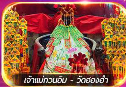
เจ้าแม่กวนอิม - วัดฮ่องกง