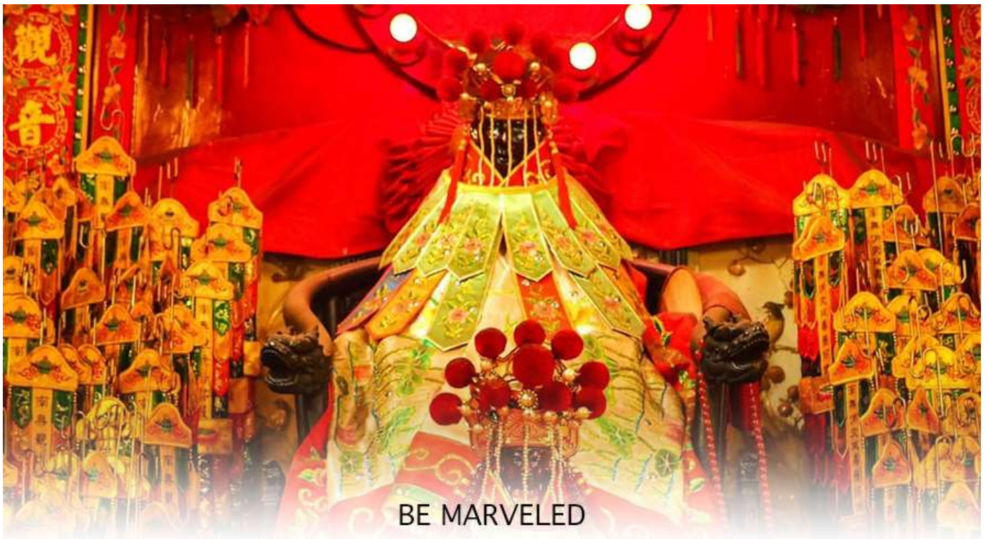
BE MARVELED วัดเจ้าแม่กวนอิมสองห้า (ยืมเงิน)

ฮ่องกง-มาเก๊า จะมี "วันเปิดทรัพย์" หรือ "พิธียืมเงิน เจ้าแม่กวนอิมฮ่องกง" เป็นวันที่จะมาขอพรและยืมเงินเจ้าแม่กวนอิมซึ่งนับจากหลังวันตรุษจีน ไป 26 วัน จะเป็นวันเปิดทรัพย์ที่จัดขึ้นในทุกๆปี พิธีนี้จะมีเพียงครั้งปีละครั้งเท่านั้น เป็นวันสำคัญอีกวันที่คนฮ่องกงมาไหว้ขอพรอย่างไม่ขาดสาย