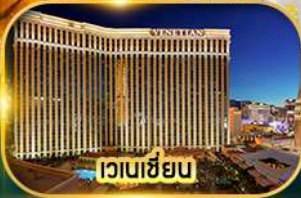
เวเนเซียน