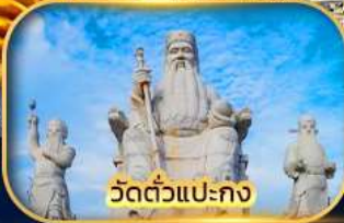
วัดตัวแปะกง