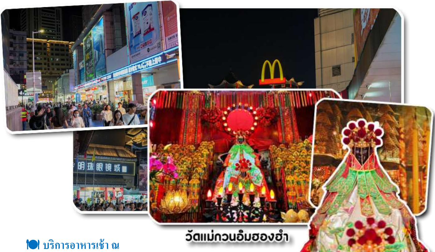
วัดแม่กวนอิมสองอ้า

ฮ่องกง - แม่กวนอิมสองอ้า - วัดปักไต้ - ร้านกั้งหัน - ร้านหยก - วัดแขก - ซุปปิ้งจิมซาจู้ - สนามบิน ( B/L/X )