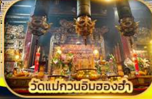
วัดแม่กวนอิมสองอ่า