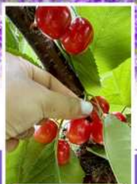
กิจกรรมเก็บเชอร์รี่

ออนเซ็น 2 คั้น นน.กระเป๋า 23 กก. 1 ใบ 6Days 4Night