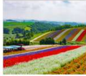
ทุ่งดอกไม้หลากสี