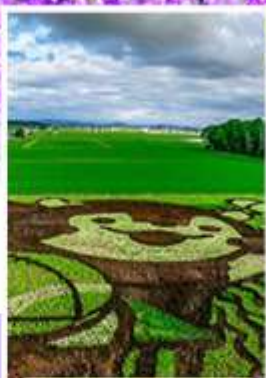
ศิลปะบนทุ่งข้าว