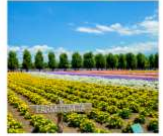
ทุ่งลาเวนเดอร์โทมิตะ