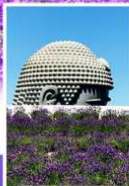
เจดีย์พระพุทธรเจ้า