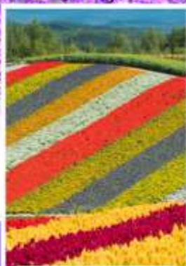
ทุ่งดอกไม้หลากสี