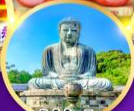
วัดโคโคคุอิน