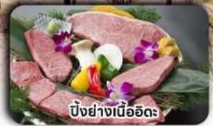
บิงย่างเนื้ออึด