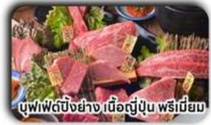
บุฟเฟ่ต์บิงย่าง เนื้อญี่ปุ่น พรีเมียม