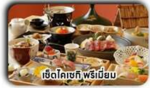
เซตโคเชกิ พรีเมียม