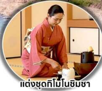
แต่งชุดกิโมโนชิมชา