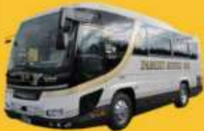
Bus (10-20 ท่าน)

➔ สำหรับท่านที่ต้องการความเป็นส่วนตัวมากขึ้น ท่านสามารถเลือกใช้บริการ รถส่วนตัวได้โดยมีรูปแบบรถให้เลือกถึง 3 ประเภท โดยรถ แต่ละประเภทสามารถนั่งได้ตั้งแต่ 2 ท่านขึ้นไป