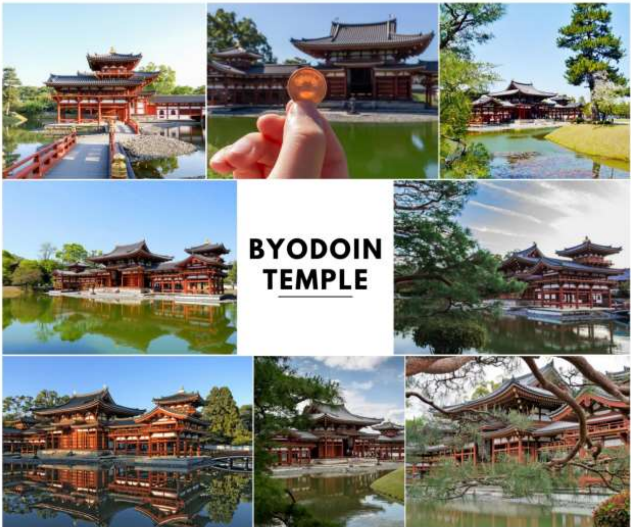
รูปภาพใช้เพื่อประกอบการโฆษณาเท่านั้น

จากนั้นนำท่านเดินทางสู่ จังหวัดเกียวโต (Kyoto) เคยเป็นเมืองหลวงของประเทศญี่ปุ่นในอดีตร่วมกว่า 1,100 ปี จึงทำให้มีสถานที่สำคัญหลากหลายแห่ง ซึ่งเต็มไปด้วยประวัติศาสตร์ และวัฒนธรรมดั้งเดิมของญี่ปุ่นมากมาย เพื่อนำท่านสู่ เมืองอูจิ (Uji) ตั้งอยู่ในจังหวัดเกียวโต เป็นเมืองเล็ก ๆ ที่ขึ้นชื่อเรื่องชาเขียวมัทฉะคุณภาพเยี่ยมระดับต้น ๆ ของญี่ปุ่น บรรยากาศเงียบสงบ เหมาะแก่การท่องเที่ยวเชิงวัฒนธรรม และพักผ่อน ไฮไลท์สำคัญ คือ มรดกโลก วัดเบียวโดอิน ที่ปรากฏบนเหรียญ 10 เยน และเป็นเมืองแห่งชาเขียวที่มีดาเฟ้ และร้านชาเปิดบริการมากมาย นำท่านสู่ วัดเบียวโดอิน (Byodoin) เป็นวัดเก่าแก่สมัยเฮอัน (ค.ศ. 1052) ที่ได้รับการขึ้นทะเบียนเป็นมรดกโลกของยูเนสโก ส่วนหนึ่งของอนุสรณ์สถานทางประวัติศาสตร์เกียวโตโบราณ จุดเด่นที่สุด คือ วิหารฟินิกซ์ (Phoenix Hall) ซึ่งเป็นอาคารไม้ดั้งเดิมที่เหลืออยู่เพียงแห่งเดียว โดยมีรูปทรงคล้ายนกฟีนิกซ์กำลังกางปีก และเป็นรูปที่ปรากฏอยู่บนเหรียญ 10 เยนของญี่ปุ่นด้วย ภายในประดิษฐานพระพุทธรูปพระอมิตาภะ (Amida Buddha) และมีพิพิธภัณฑ์โฮโซดงที่จัดแสดงสมบัติของชาติมากมาย (ราคาทัวร์ไม่รวมค่าเข้า) ใช้เวลาเดินทางประมาณ 40 นาที