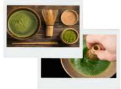
รูปภาพไฮไลท์ประกอบการโฆษณาเท่านั้น