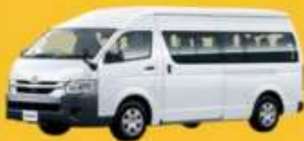
VAN (2-8 ท่าน)