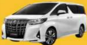
Alphard (2-4 ท่าน)