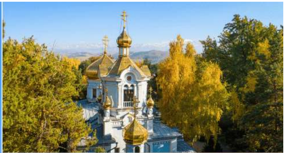
KAZAN ICON OF THE MOTHER OF GOD CATHEDRAL