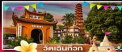
วัดเจดีย์ทอง