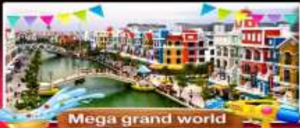
Mega grand world

ที่สุดของธรรมชาติ "วังดนามแดน" ไร่สวย ปันเช้า-กลับคืน