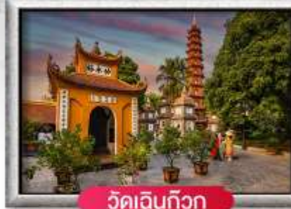
วัดเงินทิว