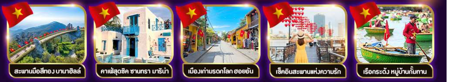
สะพานมือสีทอง บานาฮิลล์