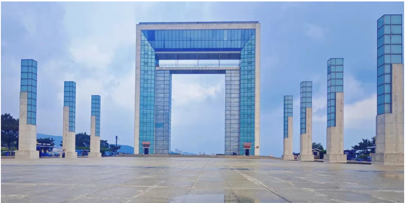
บ่าย ไปกันต่อที่ ประตูแห่งโชคกลาง สัญลักษณ์แห่งเว่ยไห่ ประตูสู่ความปรารถนา ณ ริมหาดฝั่งทะเลเหลืองที่งดงามของเมืองเว่ยไห่ ที่ตั้งของสถาปัตยกรรมอันโดดเด่นตั้งตระหง่านอยู่ นั่นคือ “ประตูแห่งความสุข” หรือ “ประตูแห่งโชคกลาง” แลนด์มาร์คที่เป็นสัญลักษณ์แห่งความหวัง ความเจริญรุ่งเรือง และความสุขของชาวเมืองเว่ยไห่ ประตูแห่งนี้ถูกสร้างขึ้นเพื่อเฉลิมฉลองครบรอบ 100 ปีของการเปิดท่าเรือเว่ยไห่ และได้รับ