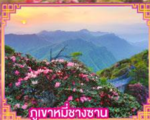
ภูเขาหมื่นช้างซาน