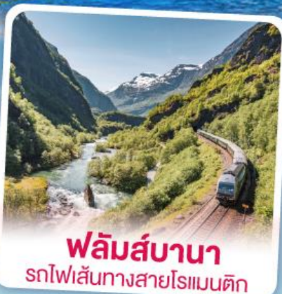
พลัมส์บานา รถไฟเส้นทางสายโรแมนติก