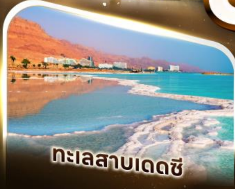
ทะเลสาบเดซี

เข้าชมพิพิธภัณฑ์แกรนด์อียิปต์ (GEM) พิพิธภัณฑ์ใหม่แกะกล่องพร้อมชม "หน้ากากตุตันคาเมน"