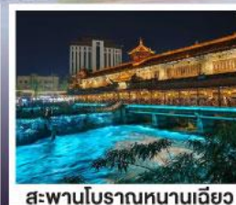
สะพานโบราณหนานเฉียว