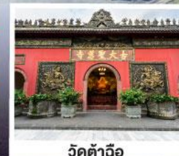
วัดคำฉื่อ