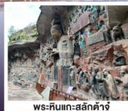
พระหินแกะสลักคำจู้