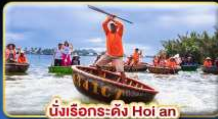
นั่งเรือระดั่ง Hoi an