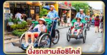
นั่งรถสามล้อฮิโค่