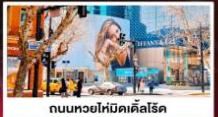
ถนนหยอไห่มีดิสโลด์