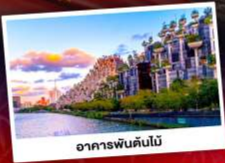
อาคารพันต้นไม้

ชมการแสดงพลุสุดปังที่สวนสนุกดิสนีย์แลนด์