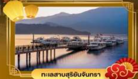
ทะเลสาบสุริยอินจินตรา