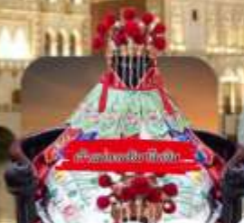
วัดของงวง