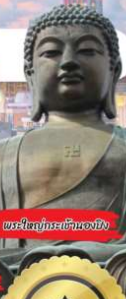
พระใหญ่กระซังของงวง