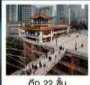
ตึก 22 ชั้น