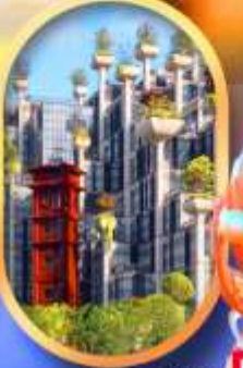
อาคาร 1,000 คับไม้