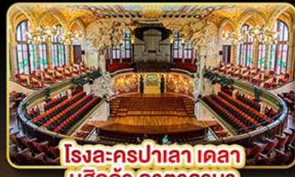
โรงละครปาเลา เดลา มุสิกก้า คาคาลานา