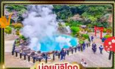
♨️ บ่อยุมิจิโกกุ