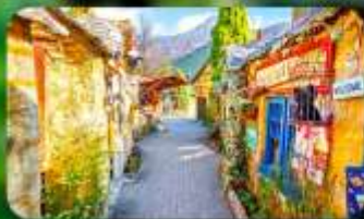
หมู่บ้านยูฟุอิน