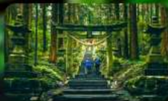
ศาลเจ้าคามิซึกิมิ