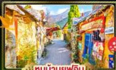
🏠 หมู่บ้านยุฟุอิน