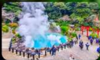
บ่อยูมิจิโถกุ