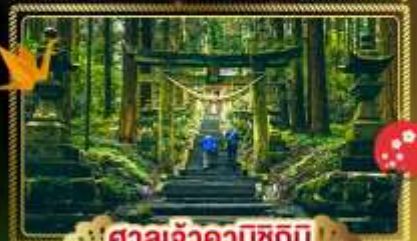
🏯 ศาลเจ้าคามิซึกิมิ