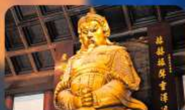
วัดเซ่งกงหมิว