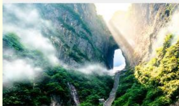
ประตูล้อมรั้ว