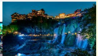
ฝูหรงเจิน

*ทางบริษัทฯ ขอสงวนสิทธิ์ในการสลับโปรแกรมทัวร์ตามความเหมาะสมขึ้นอยู่กับสถานการณ์หน้างาน โดยคำนึงถึงผลประโยชน์ของลูกค้าเป็นสำคัญ