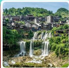
ฟูรงเจิน

• ไฮโลว์ อุกยานเทียนเหมินซาน ชมประตูสวรรค์ หุบเขาอวตาร หมู่บ้านโบราณฟูรงเจิน และแพคเกจ ล่องเรือทะเลสาบป่าแพ็งหู