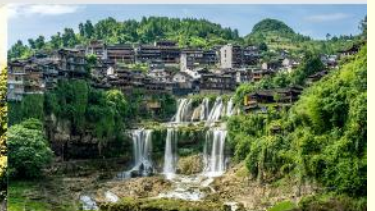
หมู่บ้านโบราณผู่หลงเจิน

*ทางบริษัทฯ ขอสงวนสิทธิ์ในการสลับโปรแกรมทัวร์ตามความเหมาะสมขึ้นอยู่กับสถานการณ์หน้างาน โดยคำนึงถึงผลประโยชน์ของลูกค้าเป็นสำคัญ