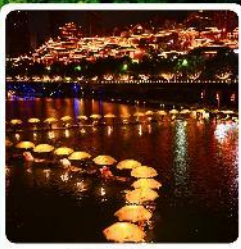
เมืองเซียนเอน