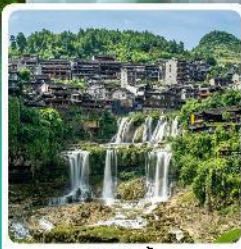
ฟูหลงจีน

• โฮลท์ อุกยานเทียนเหมินซาน หุบเขาอวตาร เมืองโบราณเซียนเอน หมู่บ้านโบราณฟูหลงจีน ภูเขาไร้ออกซิเจน อุกยานชื่อจ้อกวนด่านสิงโต