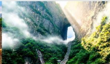
ประตูลัทธิ