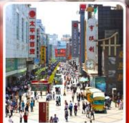
ช้อปปิ้งถนนคนเดินซุนซีลู่