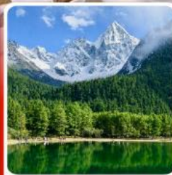
อุทยานบึงเพ็ญโก