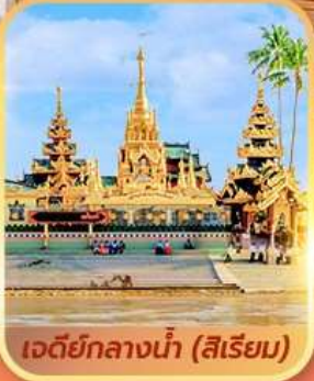
เจดีย์กลางน้ำ (สิเรียม)