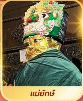
แม่ยักษ์