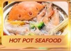
HOT POT SEAFOOD