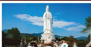
วัดเขลิ้นแอง